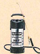
GLORIA 505 T GLORIA 505TK GLORIA 510 TK GLORIA PRO5