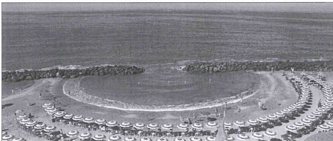
Immagine della struttura

Il soggiorno marino sarà infatti organizzato dal 13 al 27 Giugno p.v. presso la struttura alberghiera e ricettiva "PINO AL MARE" ( www.pinoalmare.it , recapiti tel. 0766570112 - 07660570027 ), situata in Via Lungomare Pirgy n. 32 a Santa Severa, a poche centinaia di metri dal Castello di Santa Severa, individuata dall'Amministrazione Comunale dopo numerosi sopralluoghi.